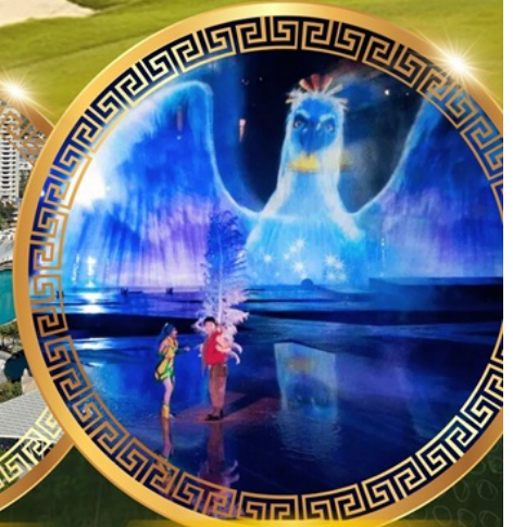
การแสดงม่านน้ำ