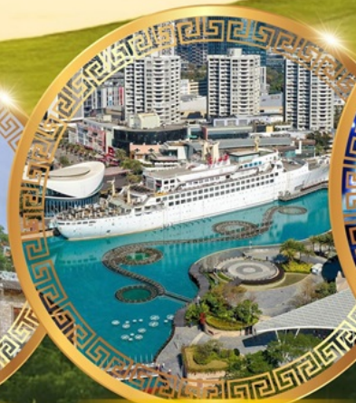
ท่าเรือ Sea World