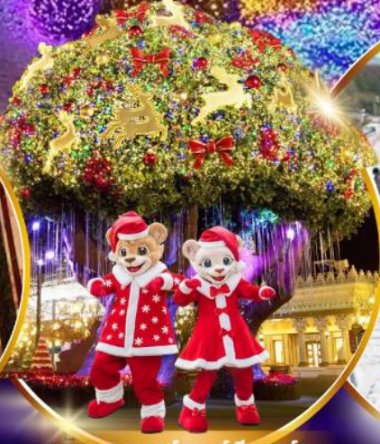
สวนสนุกเอเวอร์แลนด์ ฮิม พาร์ค