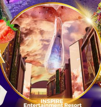
INSPIRE Entertainment Resort