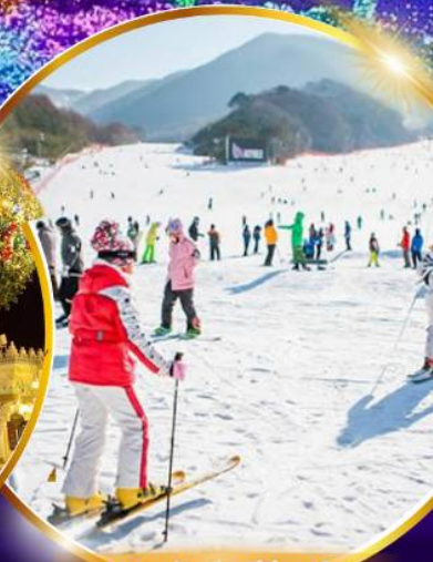
สนุกสุดมันส์ สกีรีสอร์ท

ชมจอ LED ขนาดยักษ์ที่รีสอร์ท 5 ดาว ใหญ่ที่สุดในเอเชียเหนือ สัมพัสมะสกีรีสอร์ท สนุกสุดมันส์ สวนสนุกเอเวอร์แลนด์ ชมพระราชวังคยองบกกุง ย้อนอดีตหมู่บ้านบุคซอน อันอก อิสระช้อปปิ้งคังนัม Lotte Duty Free