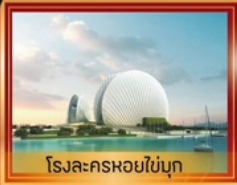
โรงละครหยอไข่มุก