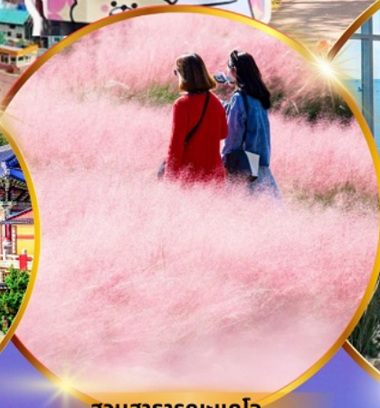
สวนสาธารณะแดโจ