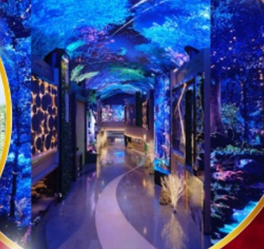
คาเฟ่ดัง Forest Outing