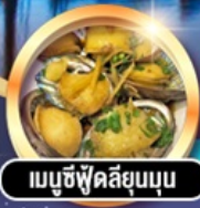
เมามูซึฟู้ดสิ่ยมมูน