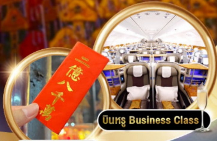
บินหรู Business Class