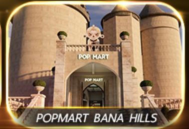
POPMART BANA HILLS

สัมผัสความงามหมู่บ้านฝรั่งเศสที่บานาฮิลล์ ช้อปปิ้ง POPMART