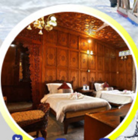
บ้านเรือ..วิมานบนดิน