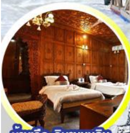
บ้านเรือ..วิมานบนดิน