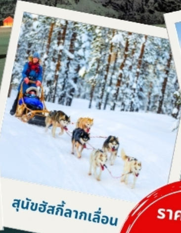
สุนัขฮัสกีลากเลื่อน