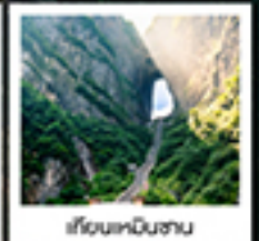
เวียงหนินฮาน

ทรนดึทกษอน / สพานกัฟโถวโถว / เขาคิยอนหนินฮาน / เรนียงเกว / ประตูลอสรัก / ไร่บงกชังจองกบาว / เขาคิยอนฮึงฮาน สวนจอนพหลโยธิน / ทาพวาทกราย / เมืองฟูรงเจิน / ลังเอียงตวนสำน้ำต๋องเจียง / เขนเมืองโบราณฝงหวงยกนทำกัน