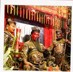
เทพเจ้ากวนอู วัดถวณไถ