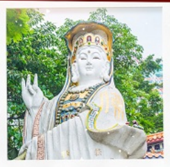
เจ้าแม่กวนอิมธิพลัสเบย์