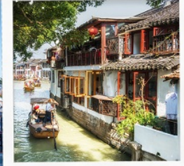
เมืองโบราณจูลีเจียเจีย