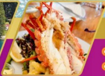
ทุ่งมัจกรทำนละครั้งต่อ