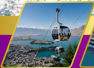
นั่งกระเช้าคอนโดล่า รับประทานอาหาร บนยอดเขาบ็อบพิก