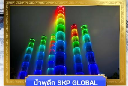
น้ำพุตึก SKP GLOBAL