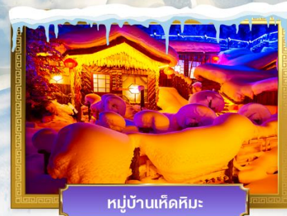
หมู่บ้านหิมะหิมะ

เดินทางโดย : สายการบินโซน่าเซาเทิร์นแอร์ไลน์