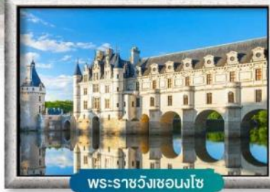
พระราชวังชองงโซ