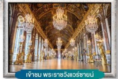
เข้าชม พระราชวังแวร์ซายน์