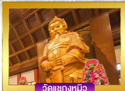
วัดแซงกหมิว