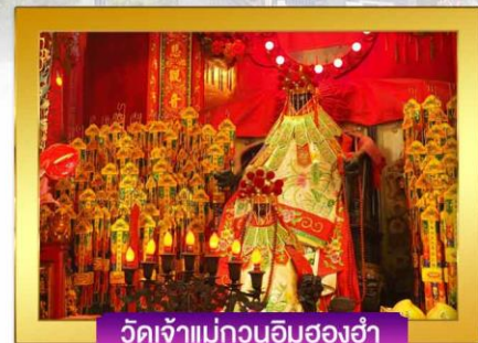
วัดเจ้าแม่กวนอิมสองฮ่า