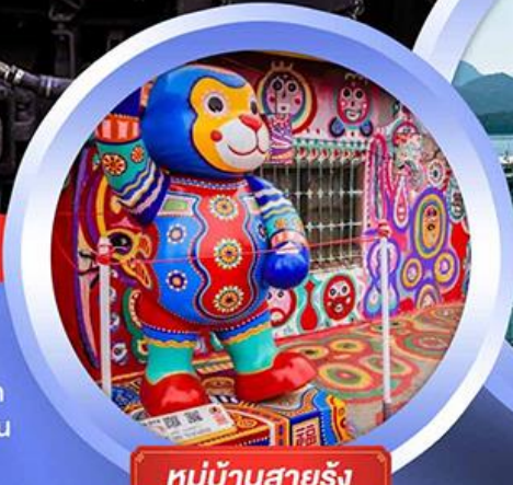
หมู่บ้านสายรุ้ง