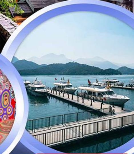
ล่องเรือทะเลสาบสุริยอันจันทร์

ช้อปปิ้งจุใจ..ตลาดกลางคืนชื่อดัง อิมอร่อยไปกับ..บุฟเฟ่ต์ชาบูสไตล์ไต้หวัน เสียงหลงเปา