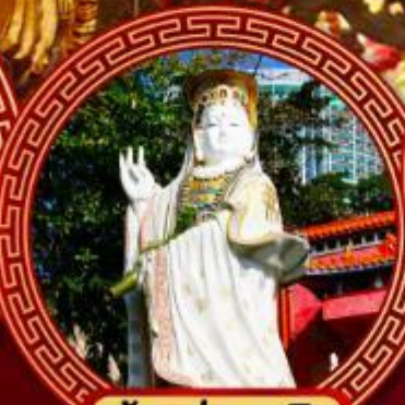
เจ้าแม่กวนอิม รีพัลส์เบย์