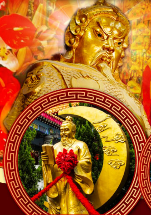
วัดหวังต้าเซียน