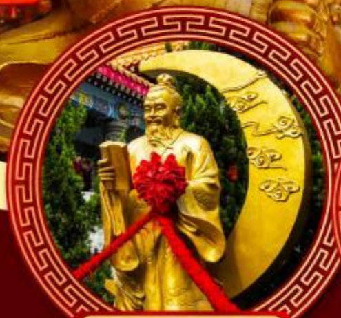
วัดหวังต้าเซียน