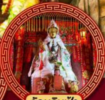
วัดหลินฟ้า