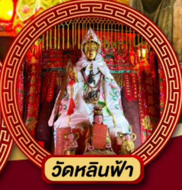
วัดหลินฟ้า