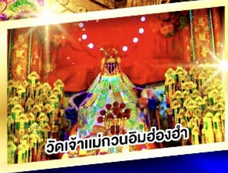
วัดเจ้าแม่กวนอิมฮ่องฮ่า