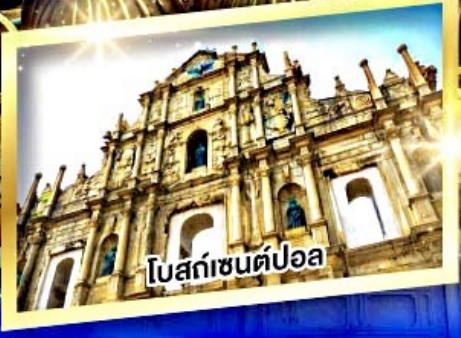
โบสถ์เซนต์ปอล

แบบพิเศษ ห่านย่าง, ต้มข้าวฮ่องกง, บุฟเฟ่ต์สไตล์ฮ่องกง