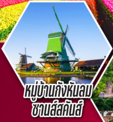
หมู่บ้านกังหันลม ซานส์คินส์