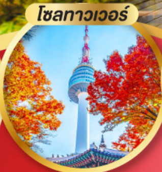
โซลทาวเวอร์