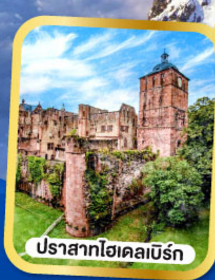
ปราสาทไฮเคลเบิร์ก