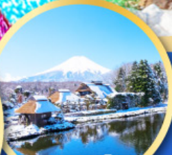
หมู่บ้านน้ำใส ไอชิโนะอัทสึ