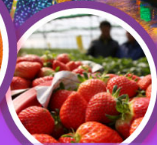
เก็บสตรอว์เบอร์รี่