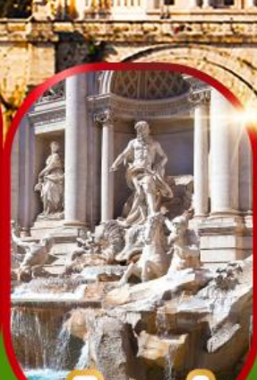
น้ำพุเทรวี่