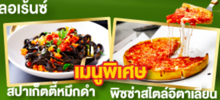
เมนูพิเศษ