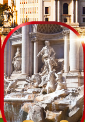
น้ำพุเทรวี่