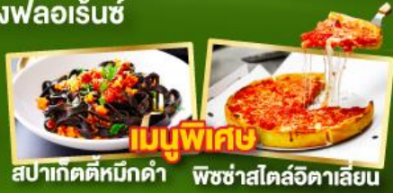
เมนูพิเศษ สปาเก็ตตี้หมักดำ พิชซ่าสโตว์อิตาลีเลียน