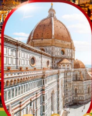
มหาวิหารฟลอเรนซ์