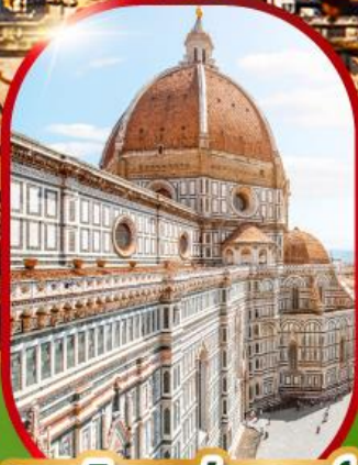
มหาวิหารฟลอเรนซ์