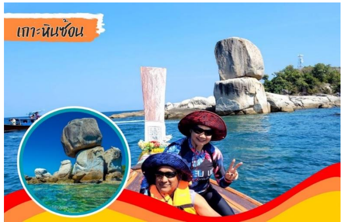
เกาะหินซ้อน

ของกรุ๊ป) เดินทางสู่ เกาะหินซ้อน ที่ธรรมชาติสร้างสรรค์ได้อย่างน่าอัศจรรย์ อิสระให้ท่านถ่ายกับประติมากรรมทางธรรมชาติ ก่อนนำท่านเดินทางต่อสู่ เกาะรอกลอย เกาะที่ได้ชื่อว่ามีน้ำทะเลที่ใสหาดทรายขาวละเอียดและสวยงามที่สุด เกาะหนึ่งใน..เหมาะแก่การเล่นน้ำถ่ายรูป หรือเดินขึ้นเขา..ชมวิวเป็นอย่างมาก