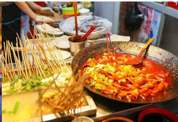
อาหารเย็น