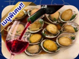
ซีฟู้ด ฟ้าอื้อโฮปสีแดง