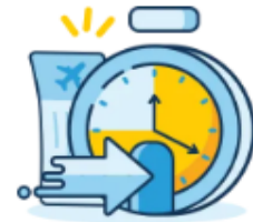
Check-in Time Limit