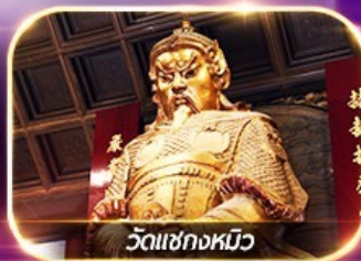
วัดเชกวงหมิว