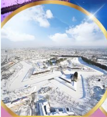
ป้อมโทเรียวกาคู