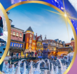
โรงงานช็อคโกแลต ชิโรอิ โคอิมีโตะ