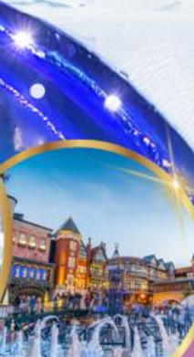
โรงงานช็อคโกแลต ชิโรอิ โคอิมีโตะ