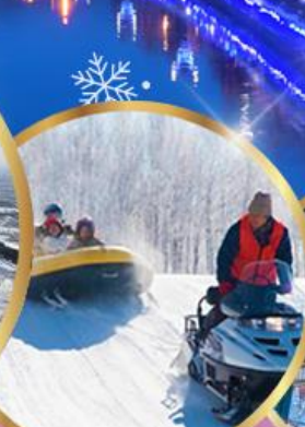
ซึทึโฮ สโนว์แลนด์