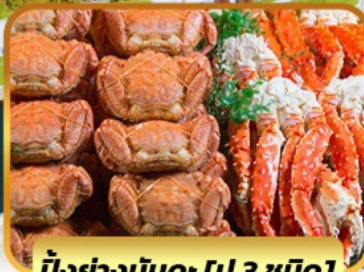
บึงย่างมันตะ [ปู 3 ชนิด]