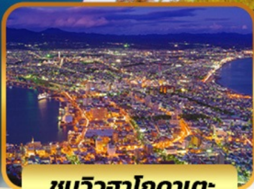
ชมวิวดาฮอกคาเตะ

SPECIAL PROMO จอง 10 ท่านแรก ลด 2,000 บาท