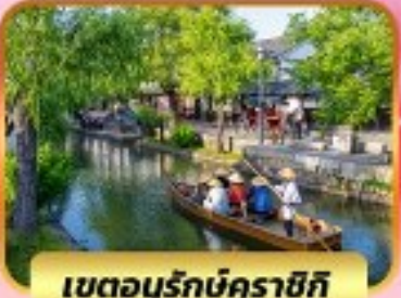
เขตอูร์กบคุราชิกิ