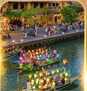
ล่องเรือลอยกระทง