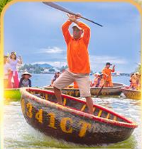
เรือกระด้ง