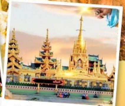
เจดีย์กลางน้ำ (สิริเรียม)