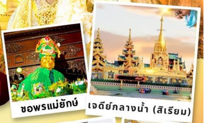
ขอพรแม่ยักษ์ เจดีย์กลางน้ำ (สิริเยม)