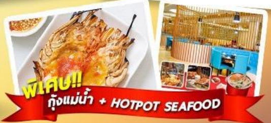
พิเศษ!! ก๊วยแม่น้ำ + HOTPOT SEAFOOD