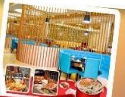
ก๊วยแม่น้ำ + HOTPOT SEAFOOD