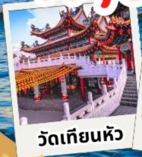
วัดเทียนหัว