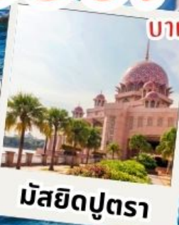
มิสยิดบุตรา