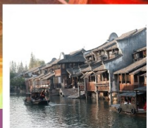
เมืองโบราณผานหลงกู่เจิน