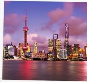
ชั้นหอไข่มุก