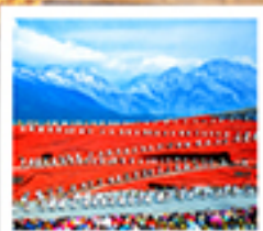
ไร่จางอวี่ทิมว