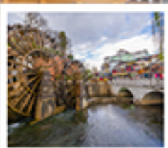
เมืองโบราณสี่เจียง