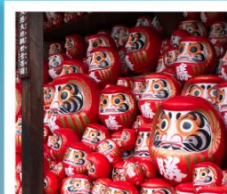
วัดคิตสึโอจิ