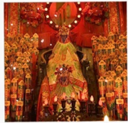
เจ้าแม่กวนอิมวัดสองฮา