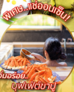
อิมมอร้อย... บุฟเฟ่ต์ซาปู

กำหนดเดินทางเดือน 26 - 31 ธ.ค.67 27 ธ.ค. - 01 ม.ค. 68 28 ธ.ค. - 02 ม.ค. 68