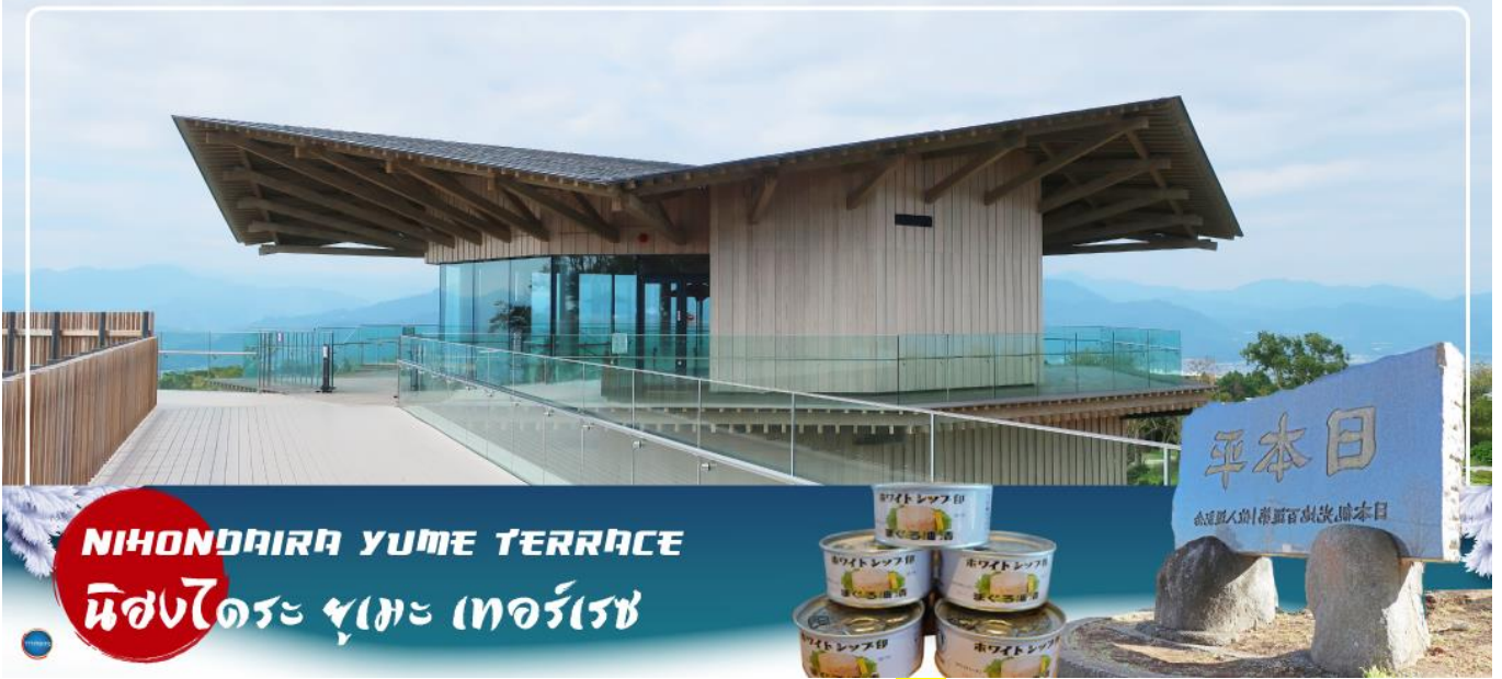
NIHONDAIRA YUME TERRACE นิสงไดระ ยูเมะ เทอร์เรซ

วันที่สี่ เมืองนาโกย่า – จังหวัดชิซุโอกะ – นิสงไดระ ยูเมะ เทอร์เรซ – น้ำตกชิราอิโตะ – เมืองยามานาชิ – หมู่บ้านโอชิโนะซึกไก – ออนเซ็น + ชาญี่ปุ่น