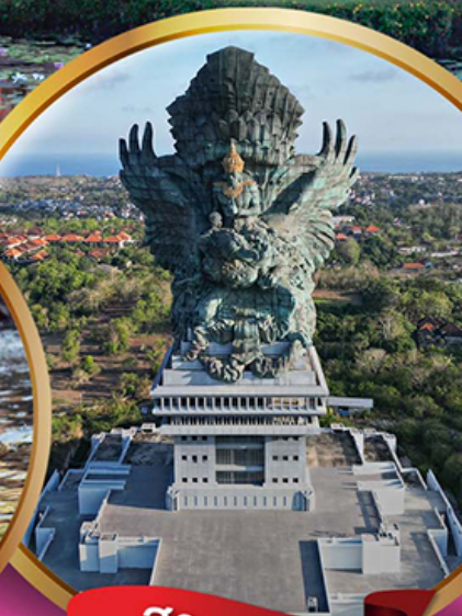
สวนวิษณุ