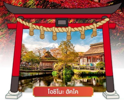
โอชิโนะ ฮักโค

เดินทางโดยสายการบิน : ไทยแอร์เอเชียเอ็กซ์