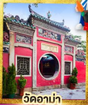
วัดอาบ่า