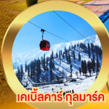
เคเบิลคาร์กุลมาร์ค