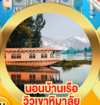
นอนบ้านเรือ วิวเขาหิมาลัย