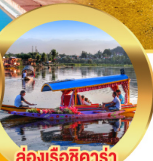
ล่องเรือซิคาร์่า