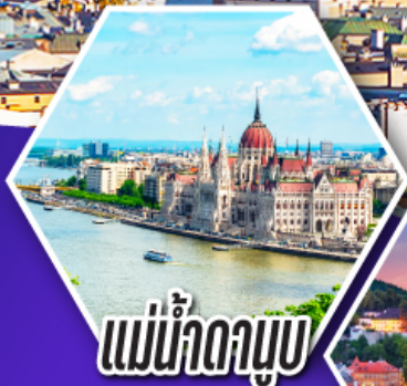
แม่น้ำดานูบ