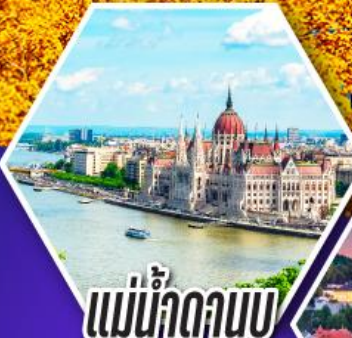
แม่น้ำดานูบ