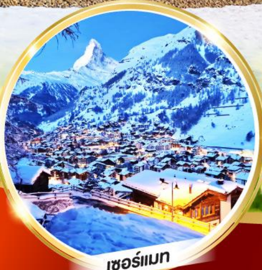
เซอร์แมท