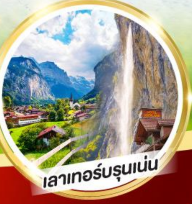
เลาเทอร์บรุนเนน