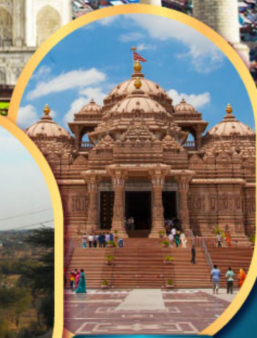
วิหารอัคราห์คัม